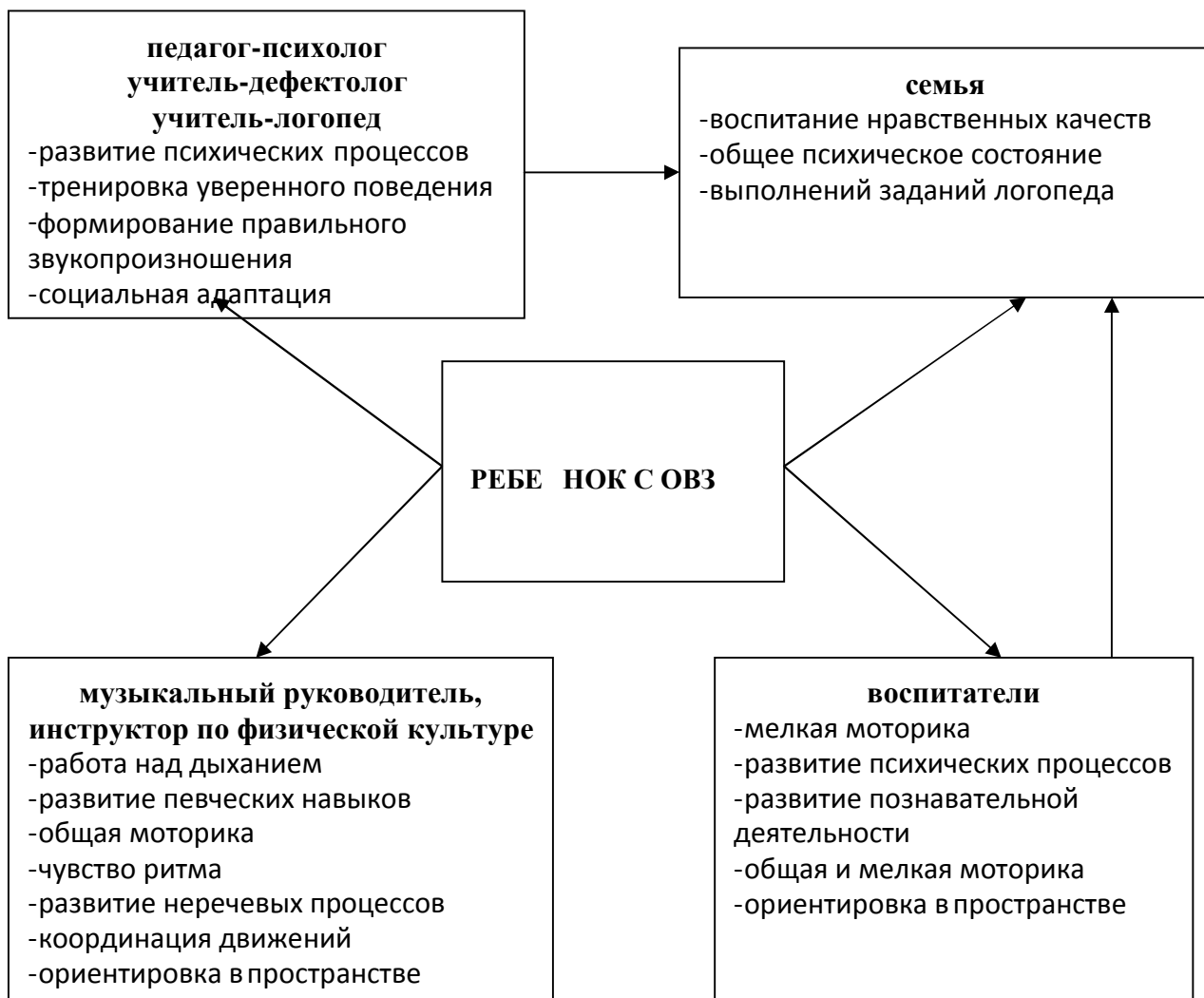
Модель взаимодействия специалистов

Данные виды деятельности являются итогом всей коррекционно-педагогической деятельности с детьми за определенный период. Чтобы все возможности детей были раскрыты, реализованы, над их подготовкой должны работать все специалисты детского сада и воспитатели группы компенсирующей направленности.